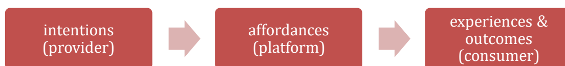
Figuur 1: visualisering 'affordance'

Deze proeftuin wil een fundamentele sprong maken in het onderzoek naar gebruikerspatronen. We doen dit door de studie van affordances centraal te stellen. Affordances zijn eigenschappen van het systeem die in interactie met een gebruiker kunnen leiden tot een bepaalde activiteit of uitkomst. Deze affordances zijn beslissend in a) de toeleiding naar een dienst, b) de beleving en het engagement op de dienst en c) het verlaten of niet-consumeren van een dienst. Die affordances gaan breder dan enkel de vindbaarheids- of zichtbaarheidsstrategieën van platformen. Affordances die meespelen kunnen ook contextueel zijn, kunnen gelinkt zijn aan de technologie en het platform zelf, aan de brand en positionering van een dienst en aan de content (kwaliteit, genres, taal). Streamers geven bijvoorbeeld aan dat het exacte moment op de dag waarop iemand content op een Vlaamse speler kijkt, van groot belang gaat zijn voor de positionering ervan in de toekomst. Factoren die meespelen zijn dan bv. plaats (op de trein, thuis, op toilet, op kantoor), tijdstip (aan de ontbijttafel, tijdens het pendelen, tijdens een snelle pauze), het device (hoeveel scherm is er ter beschikking), de levensfase van een persoon (student, gepensioneerde) of bepaalde evenementen (examens, zomervakantie, een WK, de Ramadan, etc.).